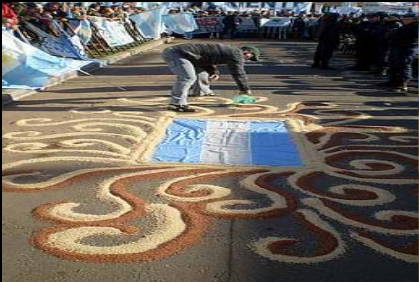
Diseños en arena de colores