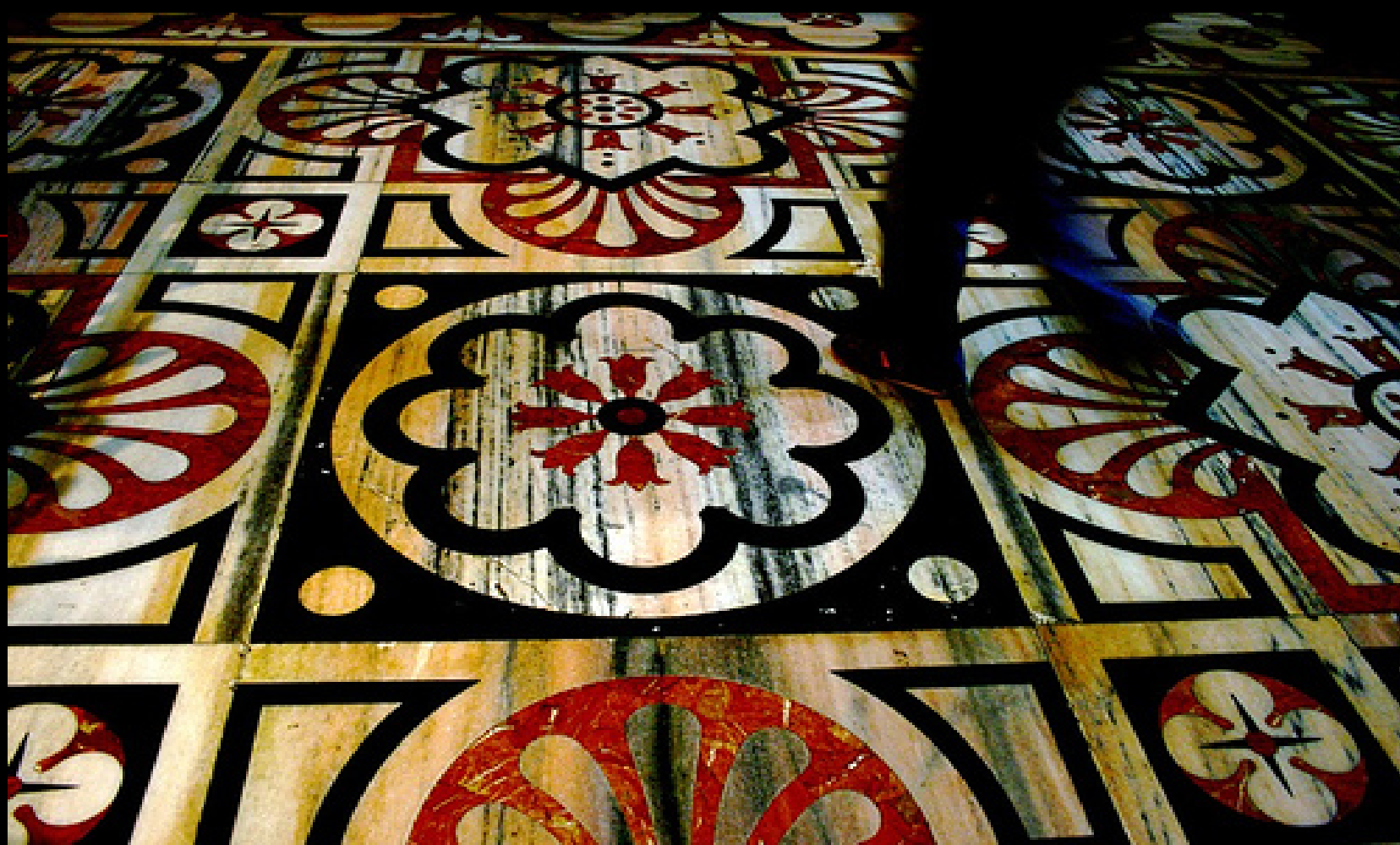
Baldozones de diseños de autor