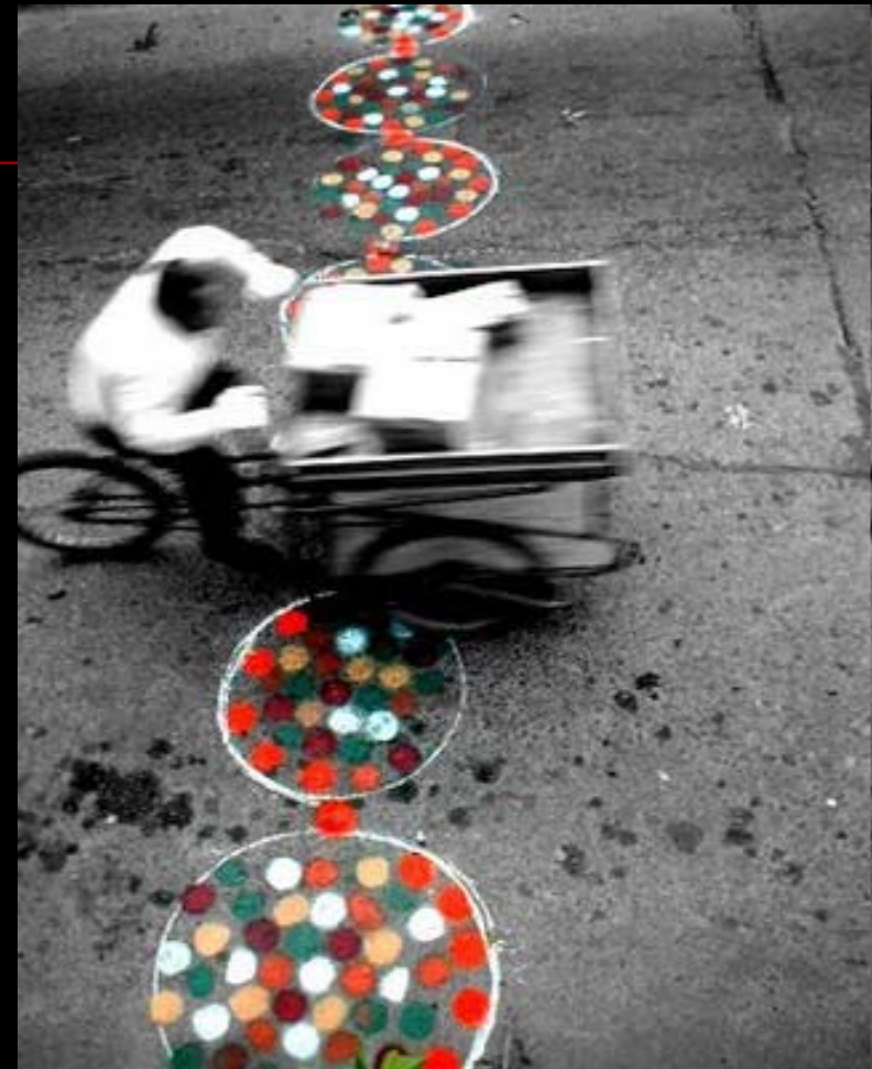
Pintura fluor sobre cemento/calle