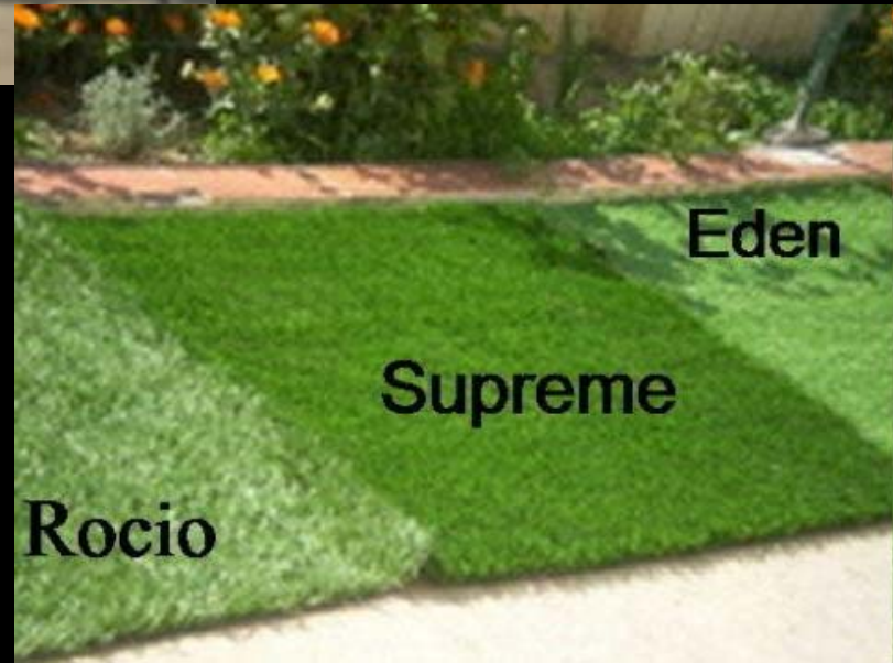
Diversos tipos de pastos.